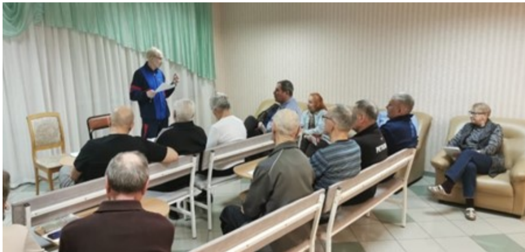
На фото: живой обмен мнениями и дискуссии среди ветеранов в санатории «Зелёная роща»