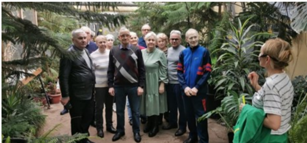
На фото: посещение республиканского лимонария в Уфе